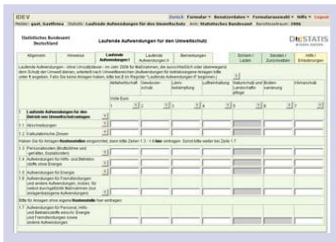
Online-Formular Laufende Aufwendungen für den Umweltschutz

Sie haben auch die Möglichkeit anderweitig erstellte Dateien in ein IDEV-Formular „einzulesen“, sie dort anzusehen, ggf. nachzubearbeiten und danach an Ihr statistisches Amt zu übermitteln. Hierbei steht Ihnen der volle IDEV-Service – von Vorprüfungen bis zu statistikspezifischen Online-Hilfen – zur Verfügung.